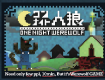
Need only few ppl, 10mins, But it's Werewolf GAME.

הגרסה המקורית למשחק איש זאב ללילה אחד יצאה ביפן בינואר 2013. המשחק זהה להצלחה ספרת תקדים, כאשר בתוך ששה חודשים, נמכר במלמעלה 10,000 עותקים. המשחק הותאם לקבוצה בת 3-7 שחקנים,